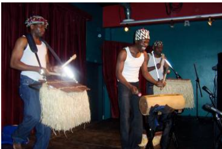
Le groupe N'TI a su faire danser les participants de cette soirée

Pour plus d'information, contactez Léona Nkoghe au tél : 819 822-4180 ou par courriel à leona.nkoghe@aide.org .