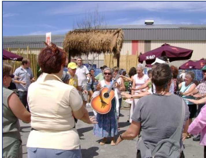
Activité de danse de l'amitié tenue lors du Pique-nique des aînés

Le Pique-nique des aînés du comité interculturel des aînés de AIDE a été une belle réussite pour briser l'isolement des aînés québécois de souche et des communautés culturelles!