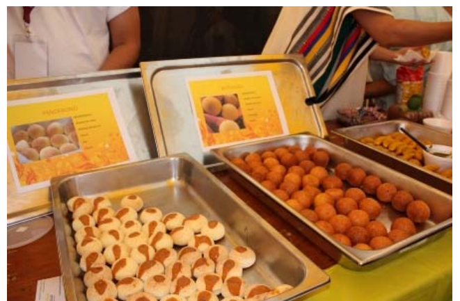
Dégustation de pandebonos et de buñuelos mexicain

Les nouveautés qu'offrait cette année l'organisme ont su attirer de bonnes foules à l'extérieur et à l'intérieur du chapiteau. Les dégustations de mets typiques des Colombiens, des Mexicains et des Africains ont permis aux gens de goûter gratuitement les saveurs de ces cultures. Par exemple les Mexicains ont servi d'excellents pandebonos et buñuelos qui ont su en faire saliver plus d'un.