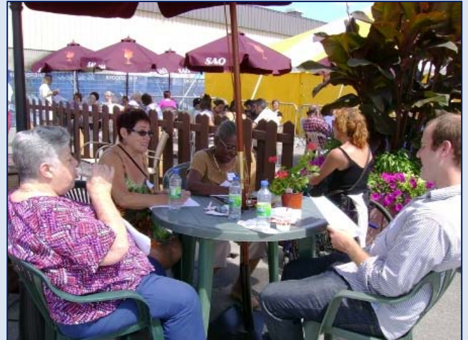
Activité Trouver la provenance des proverbes du monde.

En somme, c'est un bilan positif que dresse le comité interculturel des aînés qui espère pouvoir renouveler l'expérience au Festival des traditions du monde en 2011. En attendant, une activité de plein air est prévue pour l'automne, lisez nos prochains numéros pour en savoir davantage.