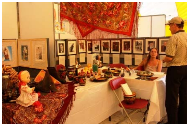
Kiosque de la communauté russophone de Montréal

Il ne faut surtout pas oublier la présence des partenaires qui ont occupé le chapiteau. En effet, les communautés russophone, mexicaine, colombienne et nigérienne étaient présentes afin d'exposer des objets d'art, des vêtements et des photographies de leurs pays. Ces beaux kiosques ont permis aux visiteurs d'en apprendre davantage sur ces cultures.