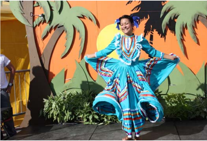
Danseuse de la Mexicaine

C'est pour cette raison que la deuxième prestation fut donnée à l'intérieur du chapiteau pour mieux permettre aux visiteurs de jouir des sonorités des violons, des trompettes et des guitares des artistes de ce groupe de musique originaire du Mexique.